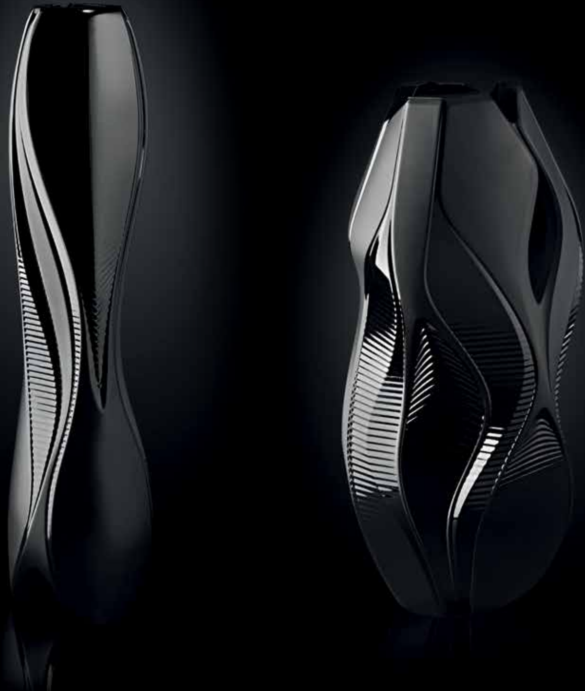
VISIO ZAHA HADID by LALIQUE 2014

Edition numérotée et signée Numbered and signed edition