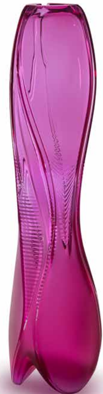
VISIO ZAHA HADID by LALIQUE 2021

Edition numérotée et signée Numbered and signed edition