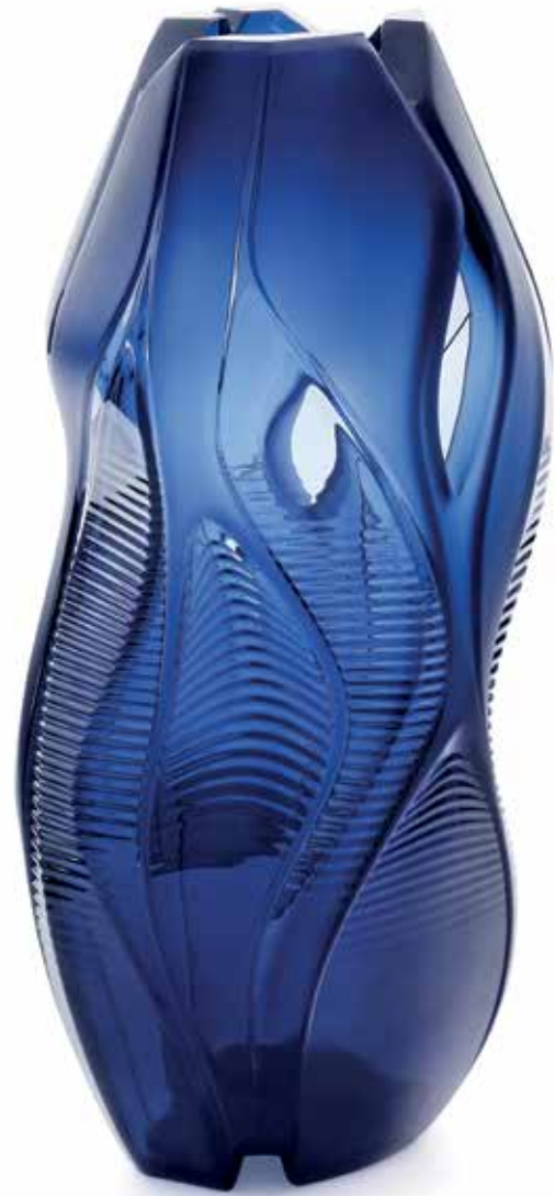
MANIFESTO ZAHA HADID by LALIQUE 2016

Edition numérotée et signée Numbered and signed edition