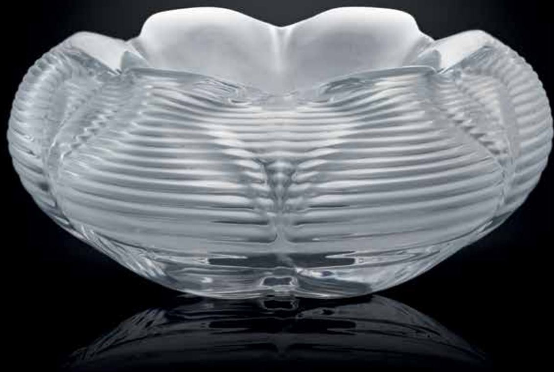
FONTANA ZAHA HADID by LALIQUE 2016

Edition numérotée et signée Numbered and signed edition