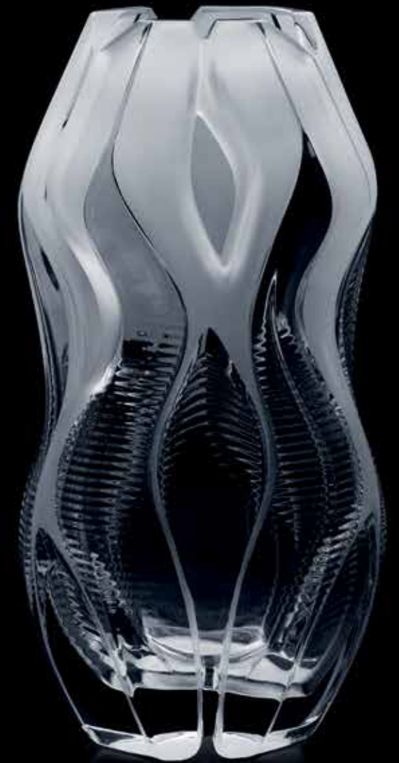
MANIFESTO ZAHA HADID by LALIQUE 2014

Edition numérotée et signée Numbered and signed edition