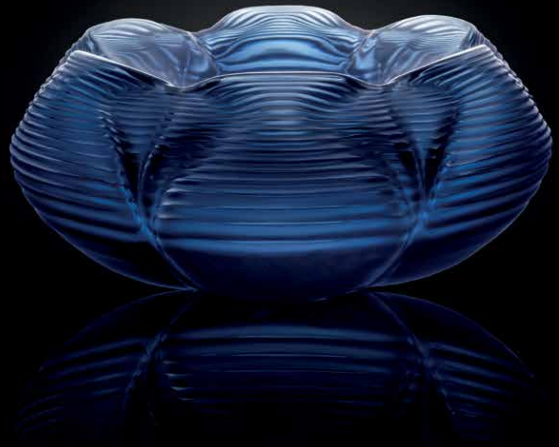
FONTANA ZAHA HADID by LALIQUE 2016

Edition numérotée et signée Numbered and signed edition