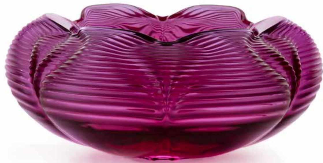
FONTANA ZAHA HADID by LALIQUE 2021

Edition numérotée et signée Numbered and signed edition