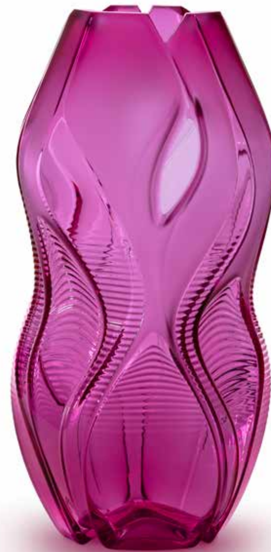
MANIFESTO ZAHA HADID by LALIQUE 2021

Edition numérotée et signée Numbered and signed edition