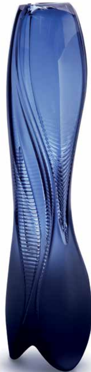
VISIO ZAHA HADID by LALIQUE 2016

Edition numérotée et signée Numbered and signed edition