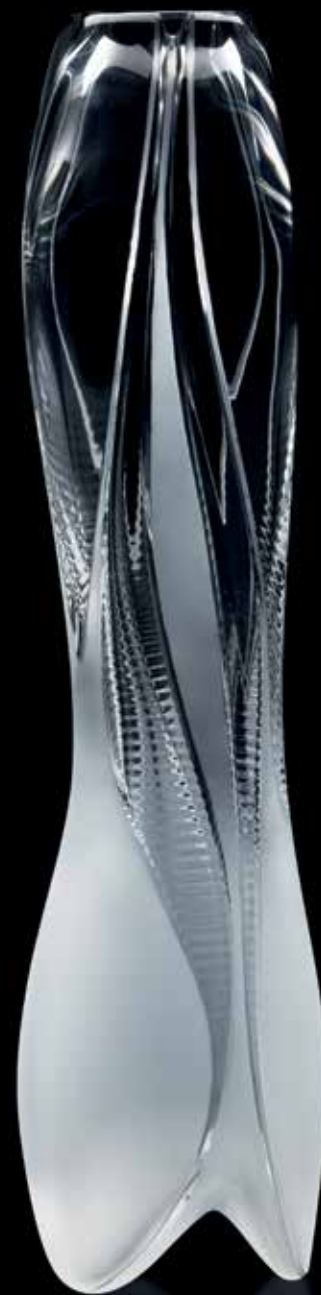
VISIO ZAHA HADID by LALIQUE 2014

Edition numérotée et signée Numbered and signed edition