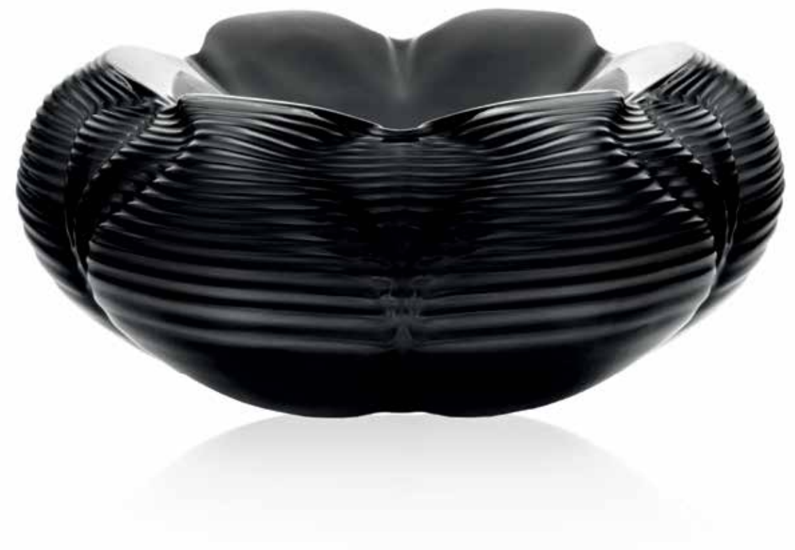
FONTANA ZAHA HADID by LALIQUE 2016

Edition numérotée et signée Numbered and signed edition